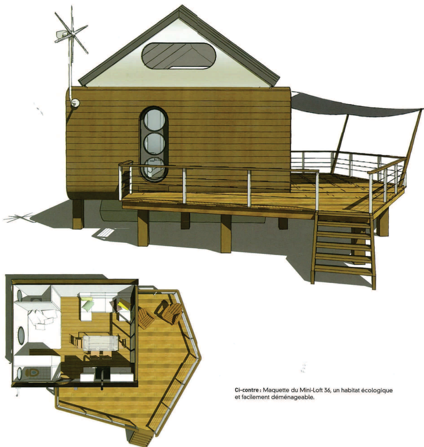
Ci-contre : Maquette du Mini-Loft 36, un habitat écologique et facilement déménageable.